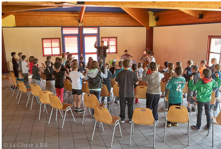
© La Clique à Bill Ateliers pédagogiques à Saint-Marcel-de-Félines, 2017

Depuis la création de ce projet, près de 1200 enfants ont bénéficié de ces initiatives. A titre d'exemple, en 2018 chaque classe concernée (9 au total) a pu se familiariser avec l'Histoire du Soldat, conte musical d'Igor Stravinsky, au cours d'un atelier présenté par des musiciens du festival. Les 250 élèves se sont ensuite retrouvés la semaine suivante à l'espace Lumière de Balbigny où les attendaient 8 musiciens professionnels et un conteur pour leur offrir deux représentations de l'œuvre dans les vraies conditions d'un concert.